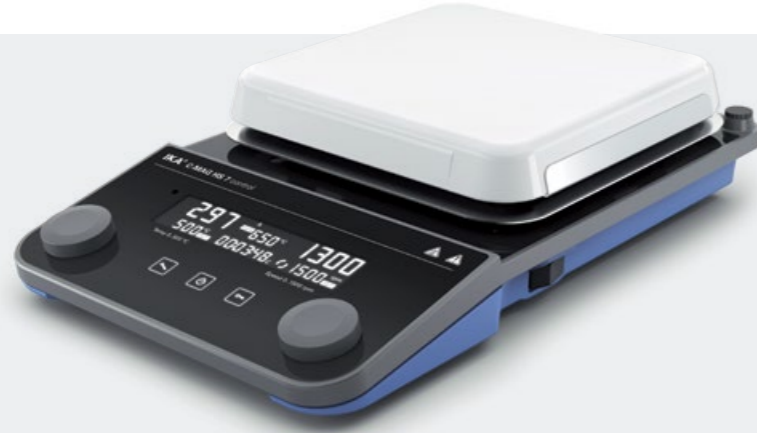
C-MAG HS 7 control