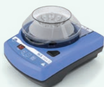
IKA mini G