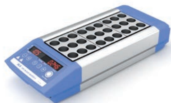
Dry Block Heater 3 干浴器 订货号: 0004025325

德国 IKA 可同时提供以下设备以供您的实验需要, 它们可连同以上选型, 成为 DNA / RNA 纯化和提取操作所需的完整方案: