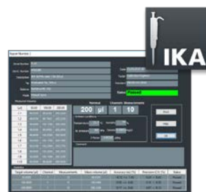
Pipette Calibration Software

通用底座, 用于夹持直径 150 mm 的 Vortex 3 垫片。 订货号: 0003342400