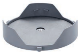
VG 3.3 通用底座

用于固定移液器的专用支架, 以便在频繁使用时方便操作。 订货号: 0020018987