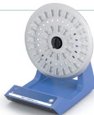
Loopster basic 转盘式混匀器 订货号: 0004015000