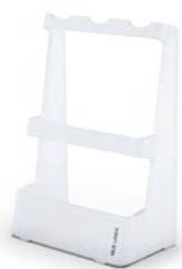
LINEA Pipette Rack

用于固定移液器的专用支架, 以便在频繁使用时方便操作。 订货号: 0020018987