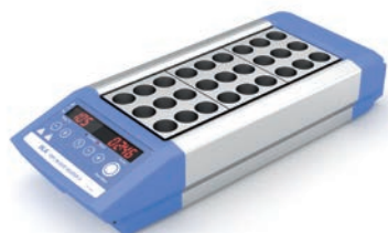
Dry Block Heater 3 Blocos de aquecimento Ident. No. 0004025300

Se necessário, os seguintes equipamentos IKA estão disponíveis para seu laboratório, para complementar as operações de trabalho realizadas na purificação e extração de DNA/RNA: