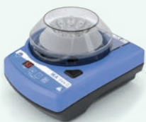
IKA mini G