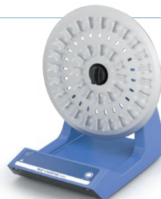
Loopster basic Aagitadores Aéreos Ident. No. 0004015000