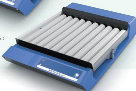
Roller 10 basic