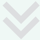
Matrix Orbital Δ