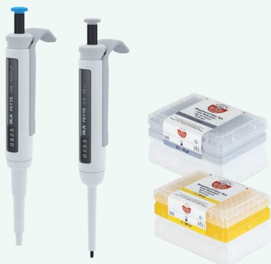
IKA PETTE vario