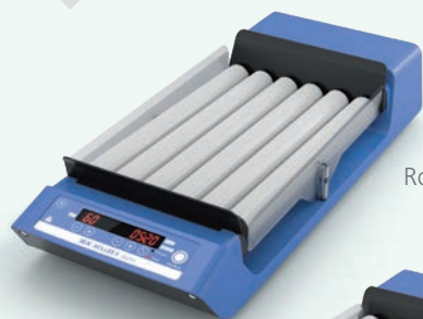
Roller 6 digital