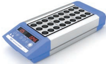
Dry Block Heater 3 Bloque Seco con calentamiento Ident. No. 0004025300

Si necesario, los siguientes equipamientos IKA están disponibles para su laboratorio para complementar las operaciones alrededor del trabajo realizado en la purificación y extracción de ADN / ARN: