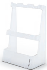
LINEA Rack de Pipetas soporte de pipetas para fácil manejo cuando usadas frecuentemente. Ident. No. 0020018987