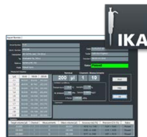
Software de Calibración para pipetas IKA provee un software con interfaz amigable para planeación, rendimiento y archivo de tests de calibración. Ident. No. 0020022141

Encuentre mas accesorios en la página web www.ika.com