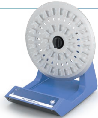
Loopster basic Agitador de tubos Ident. No. 0004015000