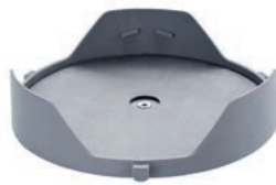
VG 3.3 Soporte Universal Soporte Universal, 150 mm para Vortex 3 con soporte de goma. Ident. No. 0003342400