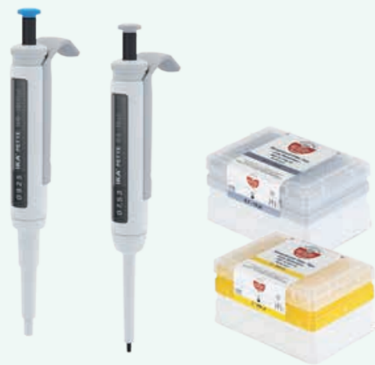
IKA PETTE vario