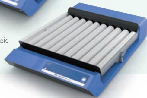
Roller 10 basic