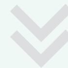
Matrix Orbital Δ