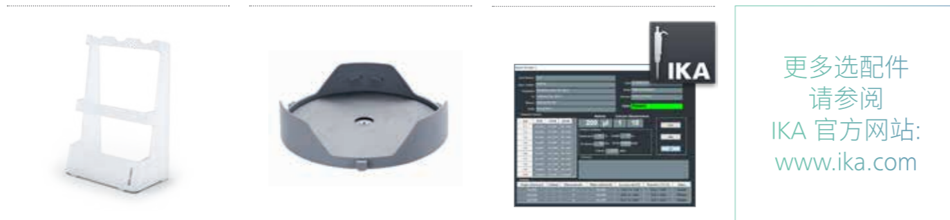
LINEA Pipette Rack 用于固定移液器的专用支架, 以便在频繁使用时方便操作。 订货号: 0020018987