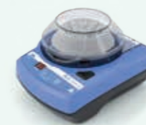
IKA mini G