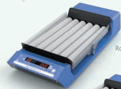
Roller 6 digital