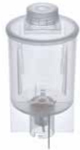
DIS-300-S-M.10 Dissolver tube

最大有效容积: 300 ml 典型应用: 药片和药物的粉碎和溶解。 此分散试管具有一个不锈钢转子, 以适应更广泛的应用领域。尤其适用于样品在不同溶剂中的溶解。 订货号 0020016318