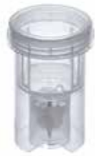
BMT-50-G 带玻璃研磨球研磨样品管 (10 个)

最大有效容积: 300 ml 典型应用: 药片和药物的粉碎和溶解。 此分散试管具有一个不锈钢转子, 以适应更广泛的应用领域。尤其适用于样品在不同溶剂中的溶解。 订货号 0020016318